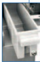
Caixa de moedas de grande capacidade (aprox. 1100 moedas)