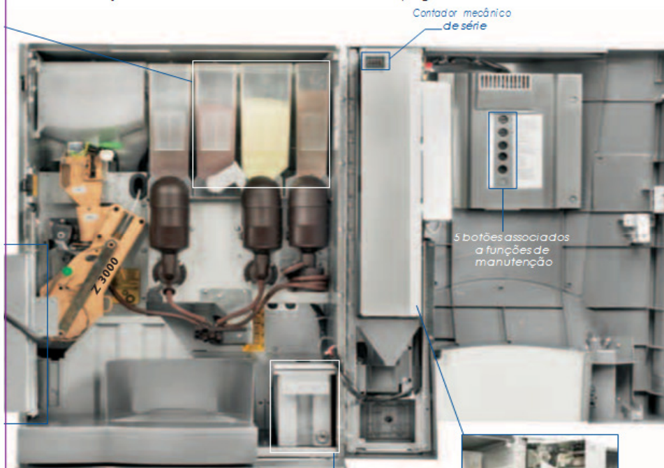
Contador mecânico de série