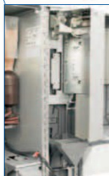
Vão protegido e acessível para os sistemas de pagamento. Moedeiro de troco ou validador instalado com sistema "cashless".